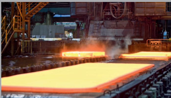
▬ Parallelrollgang -- Parallel Rolling Table

FÜR UNSERE KUNDEN FERTIGEN WIR GROBBLECHE, DIE GENAU IHREN INDIVIDUELLEN QUALITÄTSANFORDERUNGEN ENTSPRECHEN. DIE BASIS DAFÜR BILDEN UNSERE MODERNEN FERTIGUNGSANLAGEN, DIE WIR DURCH REGELMÄSSIGE INVESTITIONEN IMMER AUF DEM NEUESTEN STAND DER TECHNIK HALTEN. -- FOR OUR CUSTOMERS WE PRODUCE FOUR-HIGH PLATES THAT ARE PERFECTLY ADAPTED TO THE INDIVIDUAL QUALITY REQUIREMENTS. OUR HIGH QUALITY STANDARD IS BASED ON OUR MODERN PRODUCTION FACILITIES, WHICH ARE MAINTAINED AT STATE OF THE ART BY REGULAR INVESTMENTS.