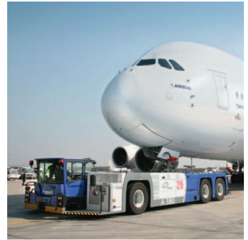
■ Beispiele für den Einsatz unserer hoch- und verschleißfesten Bleche – MAXIL® und BRINAR®: Reachstacker von Liebherr (Bild links), WM-Stadion in Durban, Südafrika (Bild Mitte), Flugzeugschlepper von Goldhofer (Bild rechts). -- Examples of the application of our high-strength and abrasion resistant steels – MAXIL® and BRINAR®: Reachstacker of Liebherr (left picture), World Cup Stadium in Durban, South Africa (center picture), Aircraft Tractor of Goldhofer (right picture).