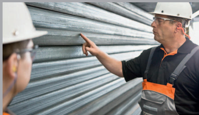
▬ Visuelle Qualitätskontrolle der Bleche -- Visual Quality Control of the Plates

Am Standort Ilseburg walzen wir für unsere Kunden monatlich 17.000 Einzelbleche mit einem maximalen Blechgewicht von 27,5 Tonnen. Dabei sorgen unser extrem steifes Quartowalzgerüst, ein selbst entwickeltes Stichplan-Rechnermodell und die Dickenmessung durch Isotopendurchstrahlung für engste Maßtoleranzen.