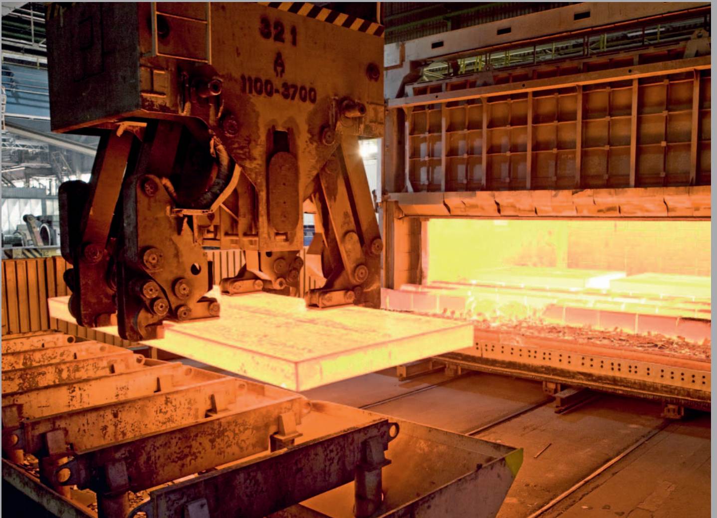
Im Herdwagenofen werden bis zu 32 t schwere Brammen für den Walzvorgang erwärmt.